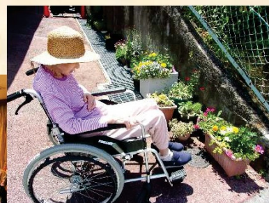
特別養護老人ホーム