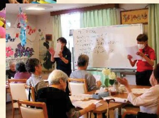
デイサービスセンター