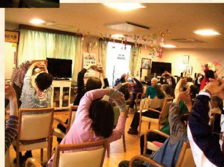
デイサービス体操風景